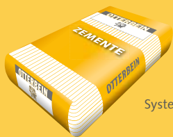
System OTTERBEIN Zemente