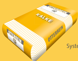
System OTTERBEIN Kalke