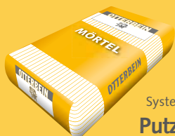
System OTTERBEIN Putze/Mörtel